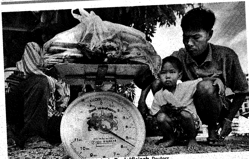
Rattenfleisch kostet doppelt so viel wie Pouletfleisch.